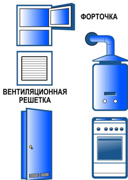
ДВЕРНАЯ ВЕНТИЛЯЦИОННАЯ РЕШЕТКА ИЛИ ПОДРЕЗКА ДВЕРНОГО ПОЛОТНА

Перед включением водонагревателя приоткройте форточку в кухне и освободите щель в нижней части двери помещения для притока воздуха, проверьте положение кранов на газопроводе - они должны быть ЗАКРЫТЫ